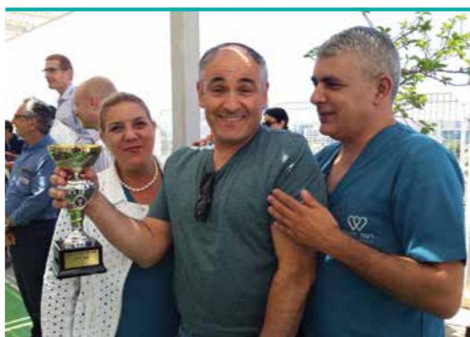
טקס עובד מצטיין 2017.