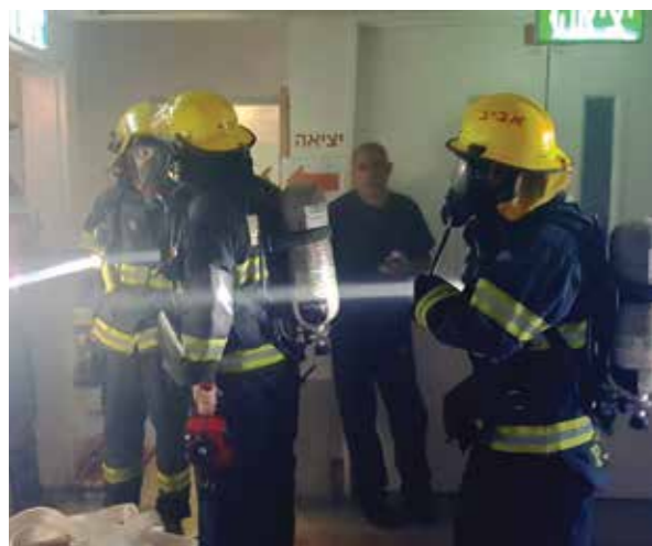
תרגיל כיבוי אש במחלקת שיקום

עשרות מעובדי בית החולים השתתפו בקורס ממונה חירום של פיקוד העורף בו הוכשרו לשמש סוכני ידע באירוע חירום. עובדים אלה אחראים להכין את המחלקות בשעת חירום והם מהווים נדבך משמעותי במתן מענה מיטבי בעת חירום.