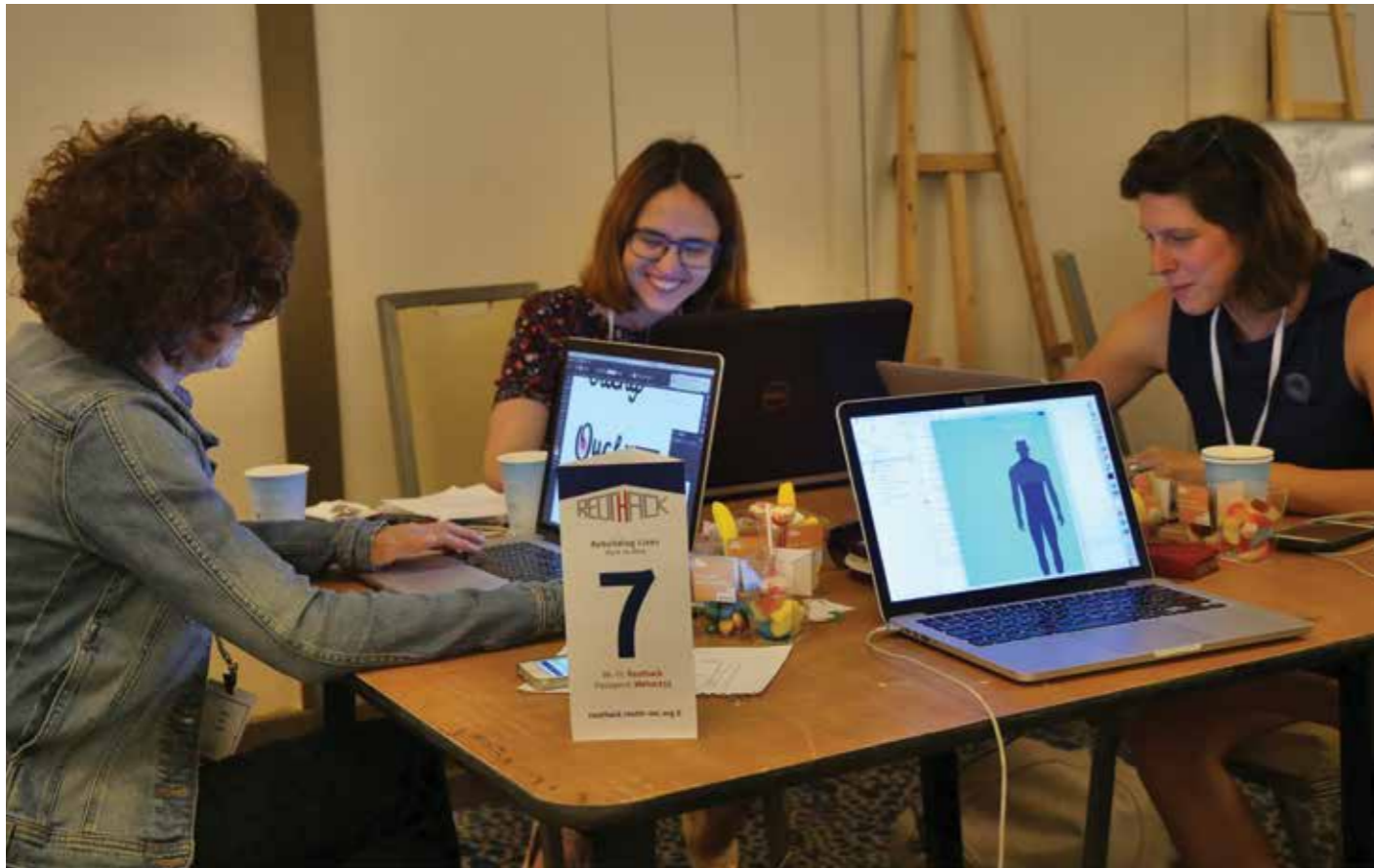
הרעיונות החדשניים הוצגו לסגל בית החולים כחלק מהפעילות להעמקת העבודה המשותפת.