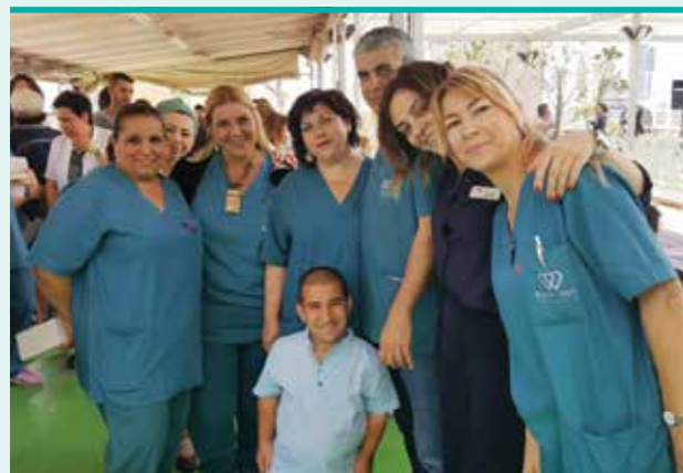
עובדי סקטור הסייעוד חוגגים את יום האחות הבינ"ל.