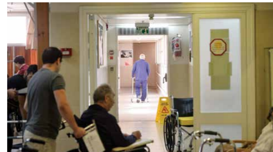
נפילות עלולות לגרום לנזק פיזי, חרדה וכגיעה בתהליך השיקום.

כ-30% מהנפילות גורמת לנזק פיזי, חרדה וכגיעה בתהליך השיקום. 3%-10% מהנפילות גורמות לנזק חמור כגון שבר, דם מוחי או אפילו מוות. מעבר לפגיעה הישירה במטופל, נפילות מאריכות את משך האשפוז ומהוות נטל כלכלי על מערכת הבריאות.