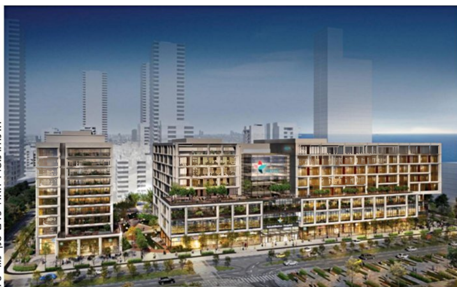
הדמיה: משרד האדריכלים יסקו-מור-סיון

בית החולים מקדם את הקמת הקמפוס השיקומי החדש, הגדול מסוגו בישראל ועם חזון מהפכני: הרחבת שירותי האשפוז ואשפוז היום, מרפאות מתקדמות, מרכז טראומה, הידרותרפיה, רפואת ספורט, מרכז דימות, חממת חדשנות ומחקר ושטחים ירוקים